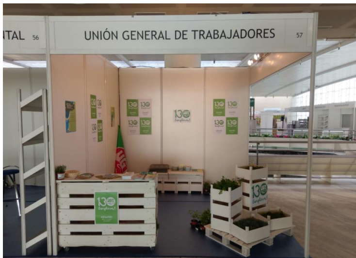
Figura 5. Fotos del stand de la Unión General de Trabajadores en el CONAMA 2018.

Actualmente se están desarrollando los trabajos correspondientes al CONAMA 2020 y señalar que desde UGT estamos participando con mayor presencia que nunca en los diferentes grupos de trabajo, esto muestra el compromiso, cada vez mayor, que tiene nuestra organización con el medio ambiente.