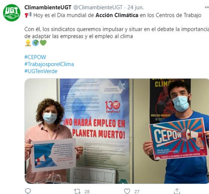
Figura 7. Twit de la cuenta @ClimambienteUGT sobre el Día Mundial de Acción Climática en los Centros de Trabajo.

En relación con la Confederación Sindical Internacional (CSI) , destacar que hemos impulsado y trabajado activamente en la campaña del día Mundial de Acción Climática en los Centros de Trabajo, campaña que lleva únicamente dos ediciones celebradas en 2019 y 2020. El objetivo de este día es impulsar y situar en el debate la necesidad de que las empresas vayan hacia un modelo productivo que genere empleo verde y empleo de calidad, donde no se quede nadie atrás, incluyendo la participación activa de los trabajadores y las trabajadoras en el proceso. Desde UGT participamos, promoviendo el envío por parte nuestro delegados y delegadas de cartas a cientos de empresas reclamando ese diálogo entre los trabajadores y las trabajadoras y los empresarios; elaborando manifiestos; dando ruedas de prensa; enviando cartas al Ministerio para la Transición Ecológica y el Reto Demográfico y lanzando campañas en redes sociales subiendo fotos y videos para dar la mayor difusión posible a la campaña.