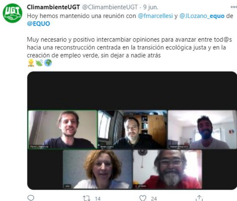
Figura 3. Twit de la cuenta @ClimambienteUGT sobre una reunión con EQUO.

Hemos dedicado un gran esfuerzo a una labor a nuestro juicio imprescindible como es el tejer redes con partidos políticos y diferentes organizaciones de la sociedad civil, como los grupos ecologistas o los movimientos juveniles y establecer sinergias con ellos.