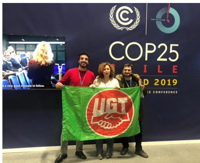
Figura 6. Fotos del stand de la Unión General de Trabajadores en el CONAMA 2018.

Además de todo el trabajo realizado en las diferentes Cumbres de las Naciones Unidas sobre Cambio Climático (COP) de estos 4 años, mención expresa requiere la COP25 celebrada en Madrid en diciembre de 2019, en la que UGT tuvo un papel muy destacado en las manifestaciones dentro y fuera de la cumbre, en los eventos celebrados dentro de la propia COP, en la contra cumbre social celebrada en las mismas fechas, en un edificio cedido por UGT y en los eventos sindicales organizados por la Confederación Sindical Internacional (CSI). Merece la pena resaltar la jornada que se organizó en nuestra sede, en la Casa del Pueblo de Avenida de América, donde se reunieron más de 150 sindicalistas de todo el mundo para marcar las líneas estratégicas en esta materia.