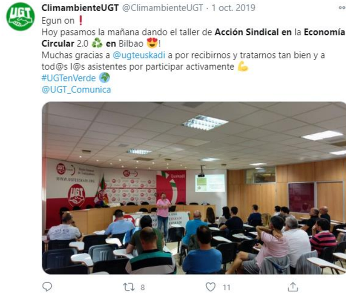
Figura 8. Twit de la cuenta @ClimambienteUGT sobre el taller celebrado en Euskadi.