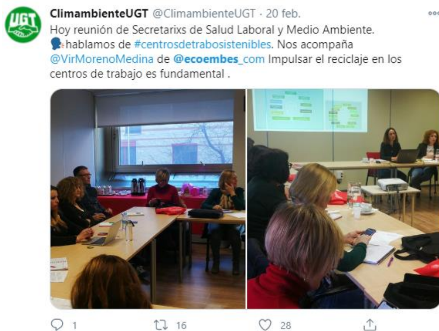
Figura 10. Twit de la cuenta @ClimambienteUGT sobre reunión de la campaña de Centros de Trabajo Sostenibles.

Además, dentro del proyecto consideramos importante establecer cada cierto tiempo jornadas sobre temáticas específicas , como la celebrada en relación con la gestión del agua en 2019, que versó principalmente sobre los planes de tercer ciclo de Planificación Hidrológica 2021-2027, que en aquel momento se encontraban en proceso de planificación y consulta pública, en la que UGT participó.