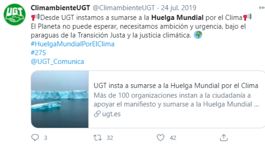
Figura 4. Twit de la cuenta @ClimambienteUGT sobre la Huelga Mundial por el Clima.

Para lograrlo, además de impulsar nuestra presencia en las redes sociales, con la nueva cuenta en twitter, hemos incrementado e intensificado nuestra presencia y participación activa en Alianza por el Clima , junto con la que hemos convocado diversas movilizaciones y manifestaciones multitudinarias (por ejemplo, la de septiembre 2019 de la Huelga Mundial por el Clima, la de la COP25 de Madrid o la manifestación virtual del 24 de abril de 2020 sobre la Acción Global por el Clima) y hemos participado en numerosos actos y jornadas.