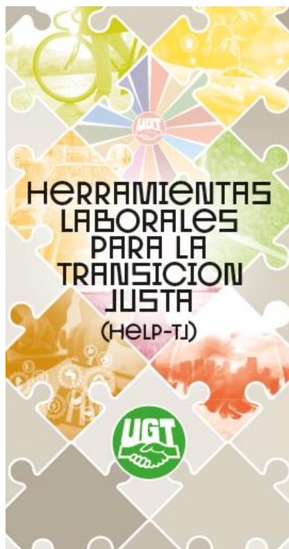
Figura 11. Portada tríptico proyecto HELP-TJ.

Ya hemos comentado que es evidente que necesitamos una transformación, hay que aprovechar los fondos provenientes de la Unión Europea y reiniciar con justicia climática y social. Por eso es el momento de una transición ecológica justa que ponga a las personas en el centro y se caracterice por la calidad en el empleo, la participación y el diálogo social, además del no dejar a nadie atrás. En esta situación, para nosotros era esencial generar herramientas que informen y formen a los trabajadores y las trabajadoras y a sus representantes sindicales ante esta nueva situación. Por lo que hemos desarrollado 8 monográficos sobre los ámbitos más implicados en esta transición.